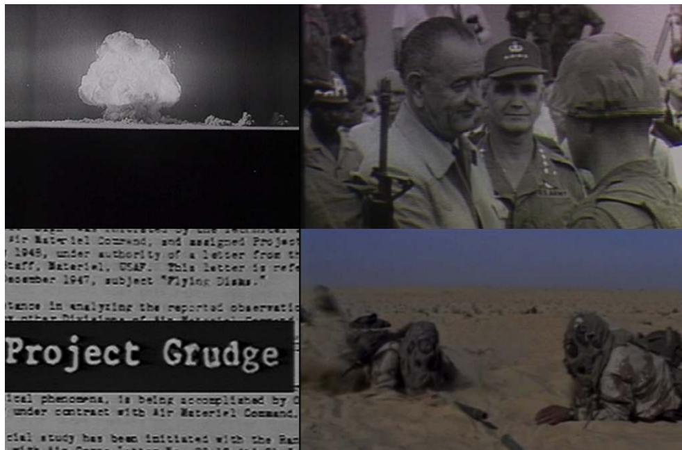
Figure 8 : La réécriture de l'Histoire militaire dans « Redux I ».