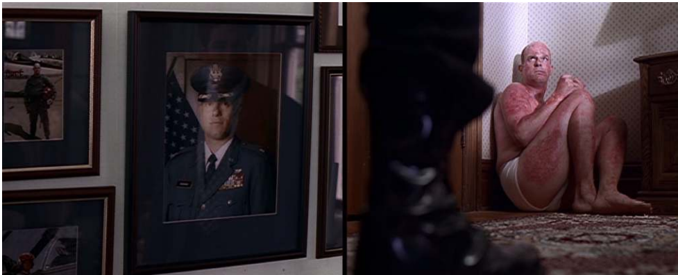
Figure 4 : Les deux visages du colonel Robert Budahas.