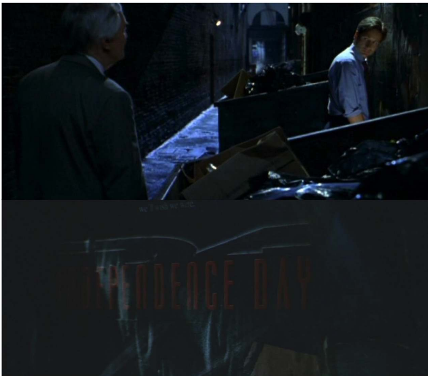
Figure 12 : Mulder donne son avis sur Independence day ( Fight the Future , Rob Bowman, 1998)

Dans « The Beginning » (6.1), Mulder explique ne jamais avoir vu Men in Black . En somme, la série maintient son discours eschatologique en repoussant des références au cinéma catastrophe, en vogue dans la seconde moitié des années 90, portant un regard beaucoup plus sombre et fustigeant la position de l'État américain.