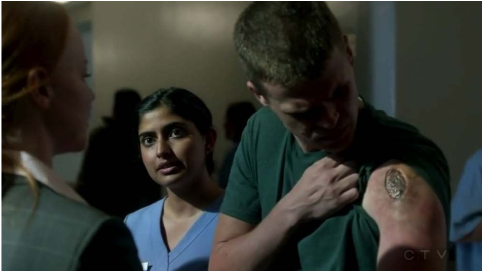
Figure 3 : Le soldat, première victime de l'invasion bactériologique.

Cette image ambivalente du soldat et le jeu des responsabilités qu'elle révèle traverse l'intégralité de la série. Au-delà même de créer une répartition dialectique entre les coupables et les victimes, la série tend à exposer les deux faces d'un problème et, surtout, à mettre en scène la persistance d'une situation de conflit dans la société américaine, en installant dans son cadre fictionnel un discours réaliste et en utilisant bon nombre de références culturelles, qu'elle valide ou rejette. La traversée des conflits, qu'ils appartiennent à l'Histoire, résonnent encore dans le présent ou fassent partie du réel contemporain, participe de la quête de transparence des deux agents, où la réalité sensible s'oppose finalement aux forces occultes et guerrières.