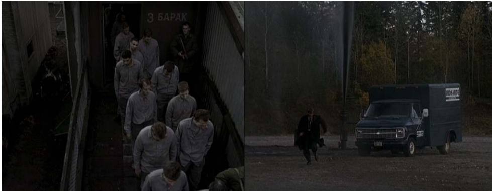
Figure 9 : Les différentes batailles dans « Terma ».

La série se pose ainsi face au monde, questionnant la fin des guerres majeures 17 et mettant en scène une situation permanente de crise 18 : une guerre sans conflit ouvert.