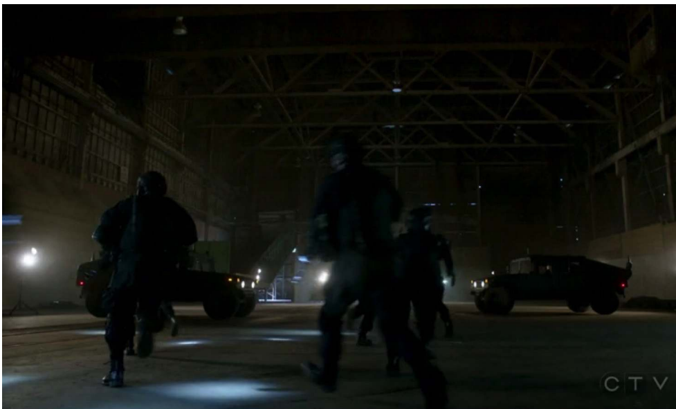
Figure 2 : La milice noire et anonyme de « My struggle I ».