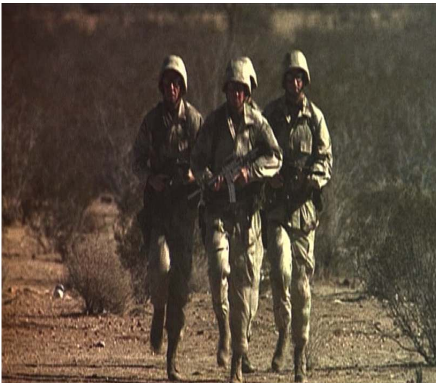
Figure 11 : Les super-soldats, cavaliers de l'Apocalypse de « Providence » (9.10)

En somme, l'homme est présenté comme un loup pour l'homme. Pour les créateurs de la série, ses dérives continuelles et les guerres répétées qu'il mène ne font que se retourner contre lui. Il court à sa perte, menant un combat factice où il se combat lui-même. Tel est d'ailleurs le discours tenu par Mulder dans « My Stuggle I » (10.5) : l'état d'urgence qui va être décrété suite aux premières contaminations permettra à ceux qui ont le pouvoir de purger la planète d'une part de ses habitants, tout en faisant croire à une invasion extra-terrestre.