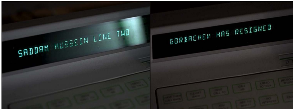
Figure 10 : le sort du monde depuis le bureau de l'Homme à la cigarette.

Il est par la suite contacté par Gorge Profonde pour l'aider à gérer une situation de crise : la récupération et l'exécution d'une entité biologique extra-terrestre. Alors que le conflit contre l'URSS prend définitivement fin, les deux hommes évoquent une guerre de plus grande ampleur entre la Terre et l'espace. Détournant l'habituelle opposition entre une autorité malfaisante et des hommes de terrain fondamentalement victimes, ils se présentent comme des soldats devant faire le sale boulot pour assurer l'avenir du monde. La « guerre des étoiles » est donc une fuite en avant, mêlant réalités (économiques et humaines) et fictions délirantes. Il est d'ailleurs particulièrement significatif que par cette immersion aux côtés de l'Homme à la cigarette, nous découvrons un écrivain médiocre et maudit utilisant son quotidien pour alimenter une œuvre policière dont les récits sont jugés au sens propre du terme extraordinaires. Dans ce contexte, fiction et réalité sont dangereusement imbriquées 21 .